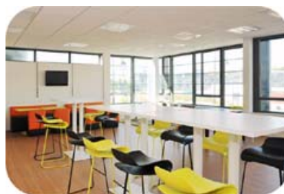
Des couleurs et de la luminosité à l'espace cafet