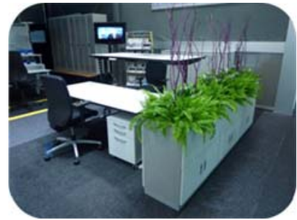
Table bench « assis-debout »

Ces salles de réunion peuvent également être construites dans du modulable, c'est-à-dire aménagées avec des cloisons mobiles qui permettent de les reconfigurer pour une conférence ou un cocktail.