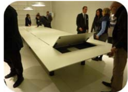
Une table équipée pour travailler en mode projet