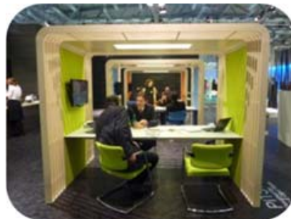
Espace de réunions informelles

Lieu de passage et d'échanges, des panneaux d'information et présentoirs mobiles diffusent les informations en interne. Un ou plusieurs écrans de TV peuvent même y être installés.