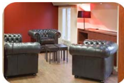
Espace détente « cosy »