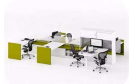
Le poste de travail est simplifié